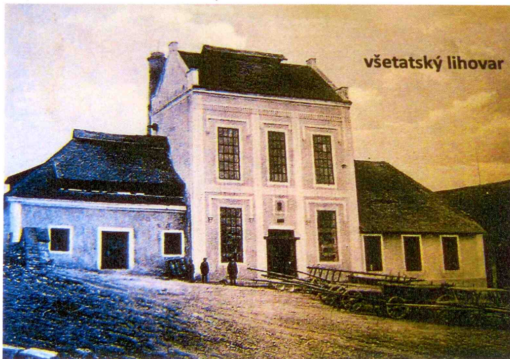
Lihovar z období kolem roku 1920