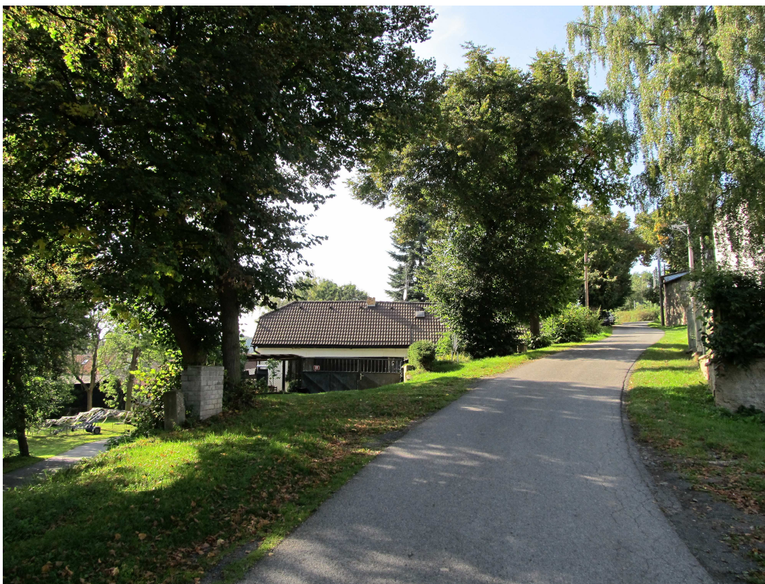
Všetatský pivovar stával v místech dnešního domu č.p. 31, naproti budově obecního úřadu