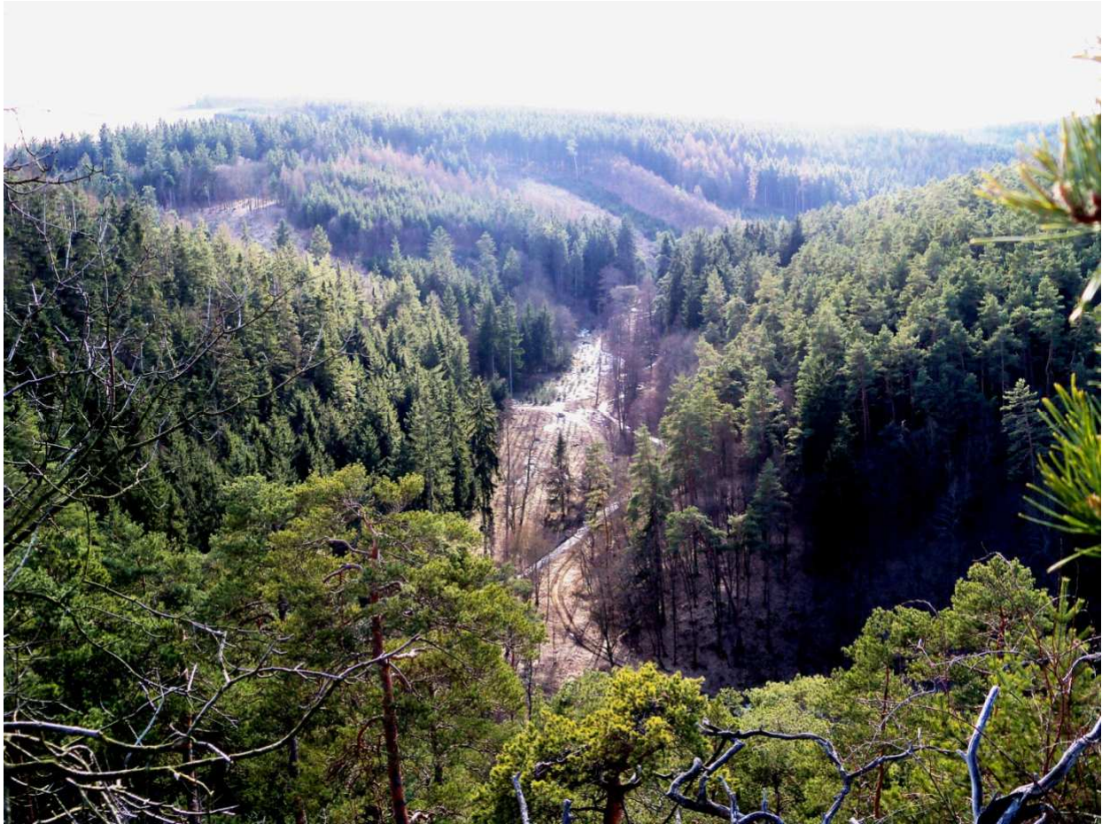
Pohled z vrcholku Valachova směrem k Tyterskému údolí

Na základě Vlastivědných sborníků zpracoval Miloš Herink st., březen 2011.